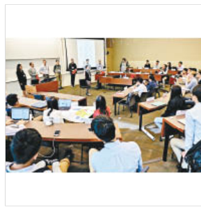
Q 美國史丹福大學商學研究院提供的課堂，除了讓學生學習商業學基本理論，還加入了創業課題。