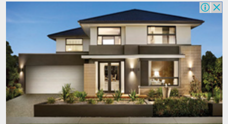
Melbourne Property Expo in Hong Kong New Melbourne House & Land from A$359,000 3 popular locations as little as 20km from the city. This weekend in HK - March 12 & 13

香港機遇處處，成為創業及投資者面向世界和走進內地市場的跳板。「2015全球創業周中國站（香港）」於剛過去的11月舉辦了一系列的活動及比賽，旨在培養本地新一代企業家，連繫潛在夥伴、導師和投資者。其中數碼港首度與美國史丹福大學商學研究院合作推出「數碼港·大學合作夥伴計劃」，帶領本地專上學生赴美參與為期1星期的硅谷金融科技創業營，與當地創業家交流和接受世界級的創業培訓，拓展國際視野。