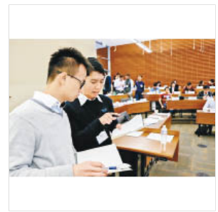
Q 除了上課，「創業營」中包括了不少小組研習，讓學生直接向專家請教及交流。