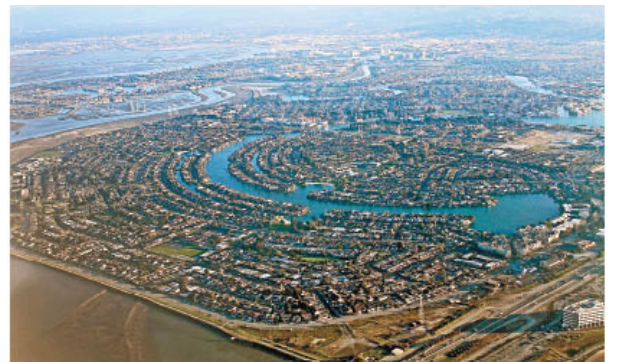
美國硅谷是全球創意產業人士的尋夢園，數碼港和美國史丹福大學商學研究院合作首推「數碼港·大學合作夥伴計劃」，帶領本地專上學生遠赴當地考察。

於2015年推出的先導計劃「數碼港·大學合作夥伴計劃」(Cyberport University Partnership Programme, CUPP)，以金融科技為主題，旨在透過國際創業培訓與交流，激發本地學生的潛能，讓他們掌握全球科技行業的發展趨勢。計劃吸引本地多間大學的學生組隊參與，每支隊伍要提交一份金融科技產品或服務報告，然後經大會篩選出18支入圍隊伍，赴美參與美國硅谷金融科技創業營。